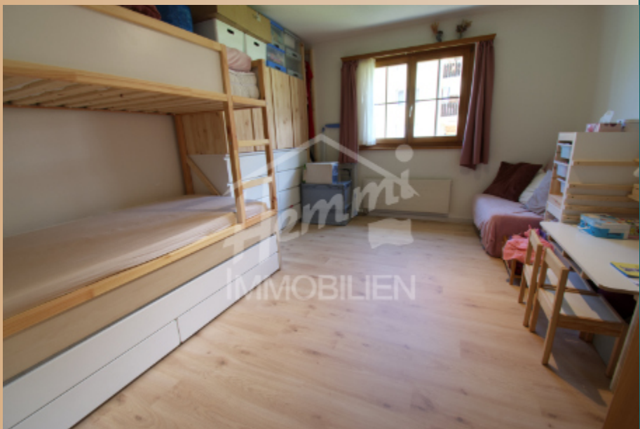
Schlafzimmer mit Nasszellen